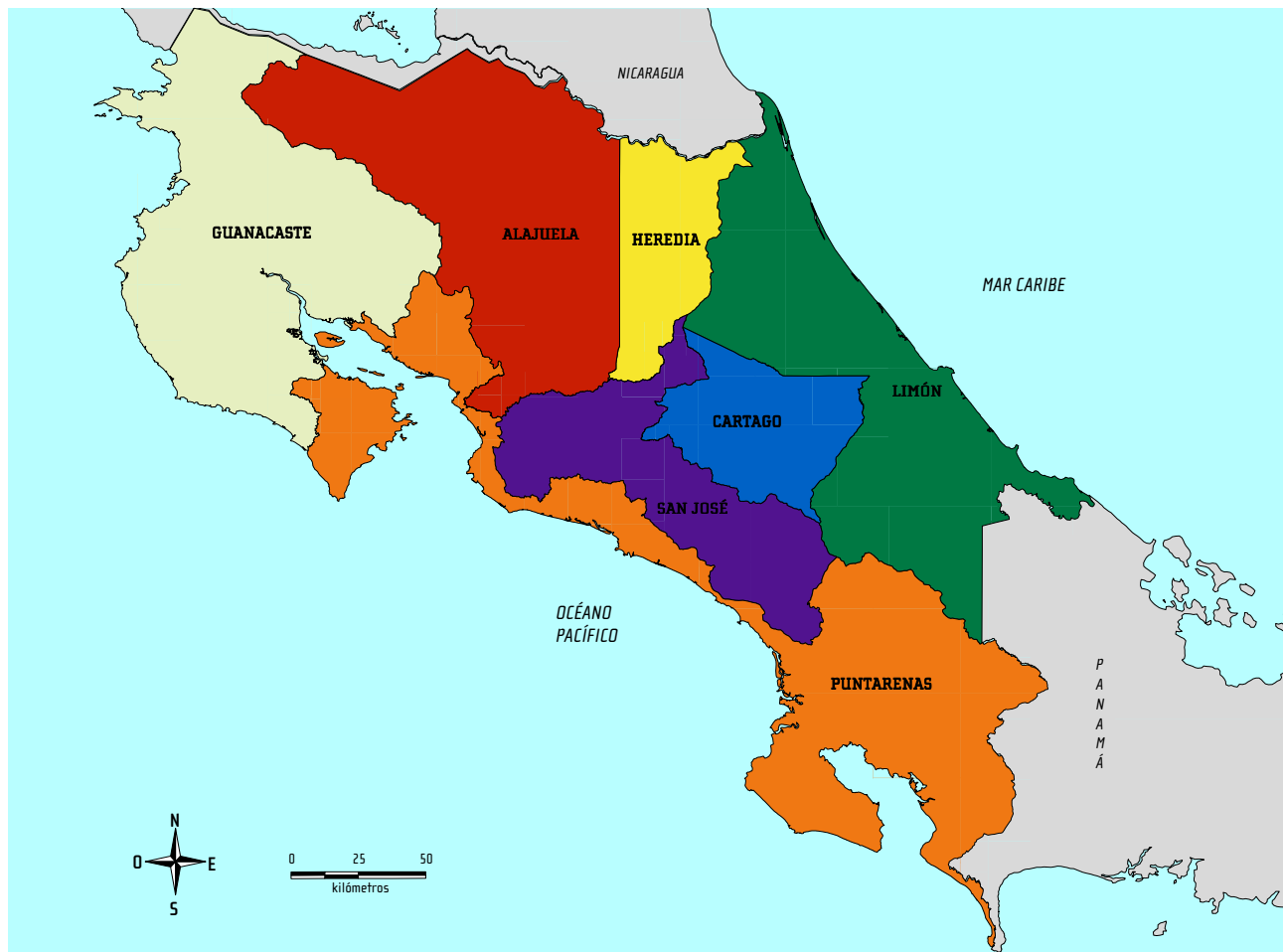
Costa Rica: Mapa de Provincias